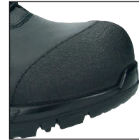
HAIX® Composite Toe Cap