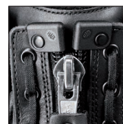
Fermeture éclair renforcée