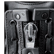
Fermeture éclair renforcée